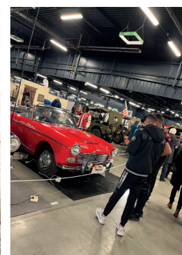
Visite du musée des 24h