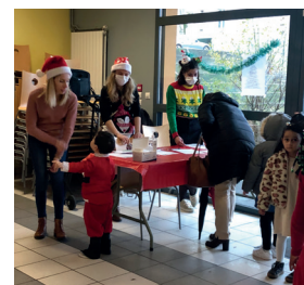
Fête de Noël

Les orientations ont pu être facilitées grâce à la référence RSA. La garde d'enfants reste malgré tout le frein principal d'accès à l'emploi pour les familles monoparentales. Nous constatons également des délais d'accompagnement qui s'allongent pour les familles nombreuses en recherche de logements T5-T6. Ceci amène à élargir notre accompagnement vers de nouvelles demandes (carte de résident, naturalisation pour les enfants).