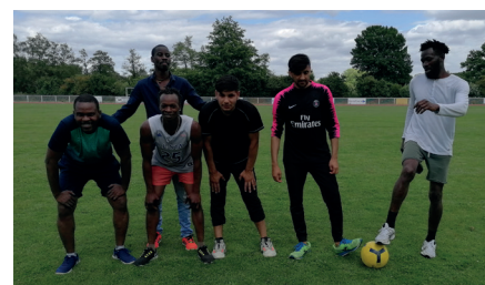
Match de Foot

En 2023 , En tant qu'établissement social et médico-social, le CADA est soumis par arrêté de programmation à une évaluation unique qui interviendra fin 2023. En ce sens, nous allons poursuivre nos démarches de mise en conformité avec la loi du 2 janvier 2002 (mise à jour du projet de service et création d'un CVS).