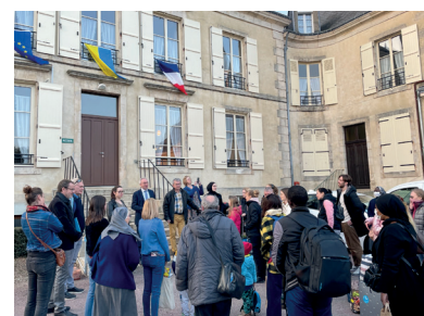
Arrivée des premiers déplacés le 22 mars 2022

73 UKRAINIENS ACCUEILLIS LOGÉS ET ACCOMPAGNÉS