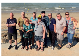
Séjour Mumia Abu-Jamal