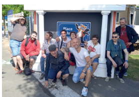
Séjour Maya Agelou

En 2023, un enjeu important autour de la mise à jour de nos conventions avec l'EP S M de la Sarthe pour notre partenariat avec la résidence accueil Maya Angelou et nos 22 appartements dit « Cellule Logement ».