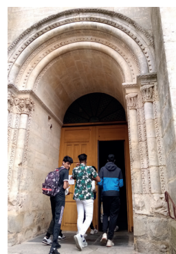
Visite de la Cathédrale Saint-Julien

logement autonome par l'évaluation des besoins, l'orientation vers les partenaires du territoire et le travail en réseau (CCAS, Relai Emploi, Mission Locale, etc.). Les jeunes s'inscrivent ainsi dans un quartier et identifient progressivement les différents acteurs. Une autonomie dans les gestes de la vie quotidienne est requise et une participation symbolique de 5€ par mois au montant du résiduel (loyer-APL) est facturée afin de maintenir les jeunes dans une dynamique d'insertion, et de valoriser leurs participations.