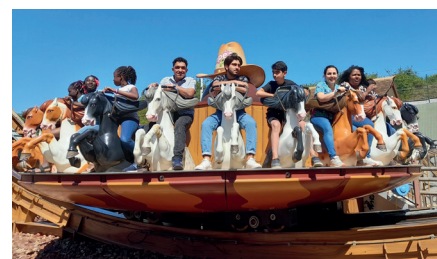
Sortie à Papea

Le renforcement du partenariat reste un axe prioritaire, plusieurs rencontres ont été organisées entre l'équipe et le tissu associatif local et de nouvelles conventions ont été signées avec France Bénévolat, Emmaus Connect, la Banque alimentaire et l'IRSA.